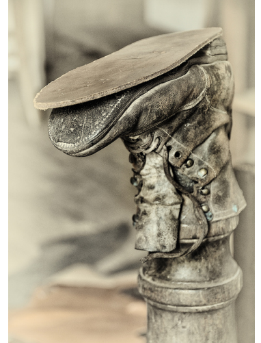
"Old boot"